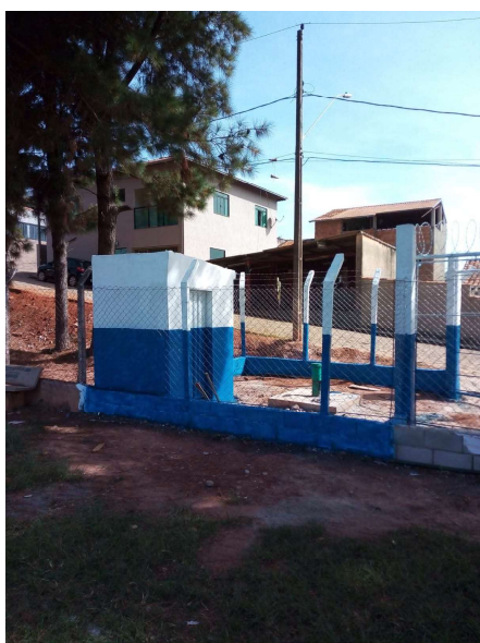
Obra finalizada e pintada