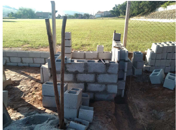
Fechamento em blocos