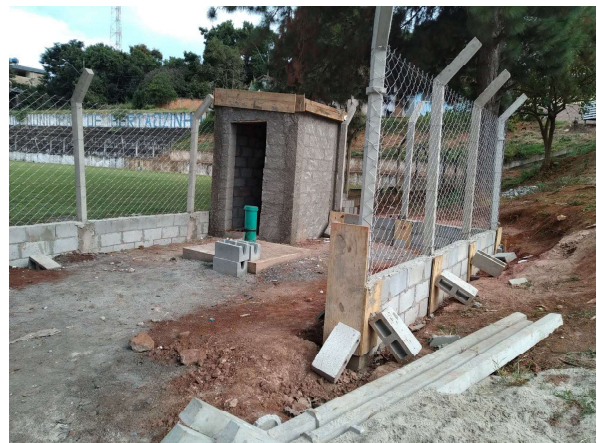
Colocação de telas