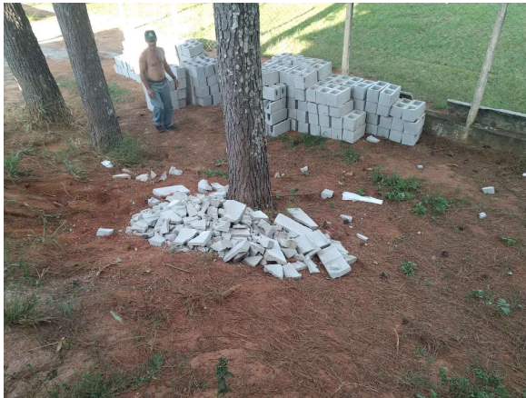
Início dos serviços