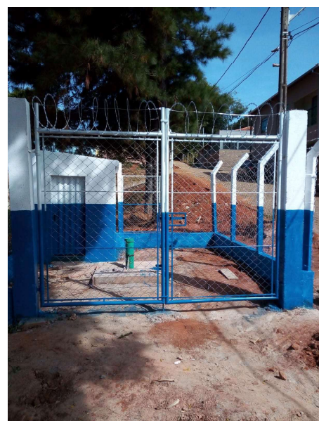
Detalhe do portão